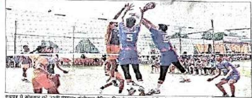
रुद्रपुर में खेल का पहला दिन 23वीं विश्व जूनियर वॉलीबॉल चैम्पियनशिप के पहले दिन में खिलाड़ियों ने मैदान पर दिखाया दमखम।

रुद्रपुर, 11 अप्रैल। 23वीं विश्व जूनियर वॉलीबॉल चैम्पियनशिप का उद्घाटन मनोज सरकार स्पोर्ट्स स्टेडियम में हुआ। शुभारंभ 21 बजों के विजयश्री के पुष्करिणी के बीच हुआ। पहले दिन खेल का आयोजन किया गया। खेल के दौरान खिलाड़ियों का उत्साह असाधारण था और मैदान में प्रदर्शन असाधारण था।