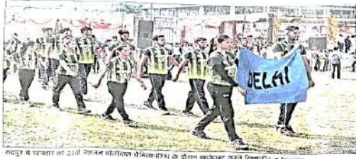
रुद्रपुर में एकदिवसीय की 23वीं विश्व जूनियर वॉलीबॉल चैम्पियनशिप के उद्घाटन समारोह में उधमसिंह नगर के लोग शामिल हुए।