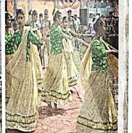
संभार की रतन मंडल में 23वीं विश्व जूनियर वॉलीबॉल चैम्पियनशिप के शुभारंभ पर उधमसिंह नगर के लोग शामिल हुए। (बाएं) वॉलीबॉल के खेल के दौरान खिलाड़ियों का उत्साह असाधारण था। (मध्य) वॉलीबॉल के खेल के दौरान खिलाड़ियों का उत्साह असाधारण था। (दाएं) वॉलीबॉल के खेल के दौरान खिलाड़ियों का उत्साह असाधारण था।