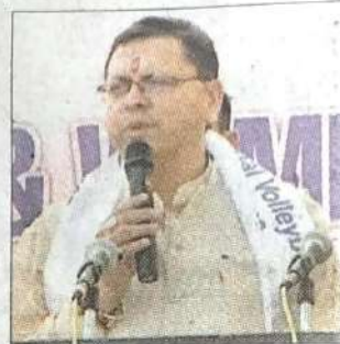
संबोधित करते सीएम धामी।

विधानसभा चुनाव में भाजपा को बहुमत दिलाने वाले पुष्कर सिंह धामी खटीमा से चुनाव हार गए हैं। ऐसे में उपचुनाव के माध्यम से पार्टी उन्हें जीत दिलाने के प्रयास में है। समय के साथ ही यह चर्चा तेज होती जा रही है कि सीएम धामी प्रदेश की किस सीट से चुनाव लड़ेंगे। सियासी गलियारों में चर्चा है कि सीएम धामी पिथौरागढ़ के डीडोहाट, चंपावत, बागेश्वर के कपकोट व नैनीताल जिले की किसी सीट से चुनाव लड़ सकते हैं। वहीं चुनाव परिणाम आने के बाद भारतीय जनता पार्टी के पांच विधायकों ने सीएम के लिए अपनी सीट छोड़ने की बात कही थी। ऐसे में सीएम किस सीट से चुनाव लड़ेंगे अभी तक यह तय नहीं हो सका है। सोमवार को यहां पहुंचे सीएम ने