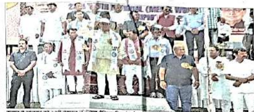
रुद्रपुर में एकदिवसीय की 23वीं विश्व जूनियर वॉलीबॉल चैम्पियनशिप के उद्घाटन समारोह में मुख्य अतिथि के रूप में उधमसिंह नगर के लोग शामिल हुए।